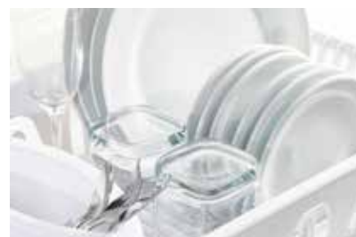
Schoon (vaat-)was resultaat